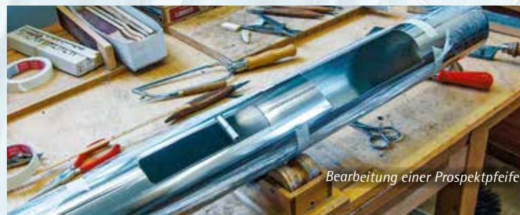
Bearbeitung einer Prospektpfeife

Wenn ihr vorhandenes Orgelwerk verschmutzt ist oder sich Schimmelbefall eingestellt hat, können wir helfen. Reinigungen, Reparaturen oder andere Spezialarbeiten führen wir mit höchster Akribie und Behutsamkeit durch und sorgen in allen Fällen für Zufriedenheit und damit auch für den guten Ton.