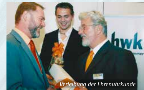
Verleihung der Ehrenuhrkunde

Einen Schwerpunkt bildet bei uns auch die Ausbildung von Nachwuchs: Die Orgelbau firma Franz Schreier ist ein Lehrbetrieb, der mit der silbernen Ehrennadel des Schwäbischen Handwerks ausgezeichnet wurde. Interesse? Dann bewirb Dich für eine Ausbildung zum Orgelbauer per Mail oder per Post an die angegebene Adresse.